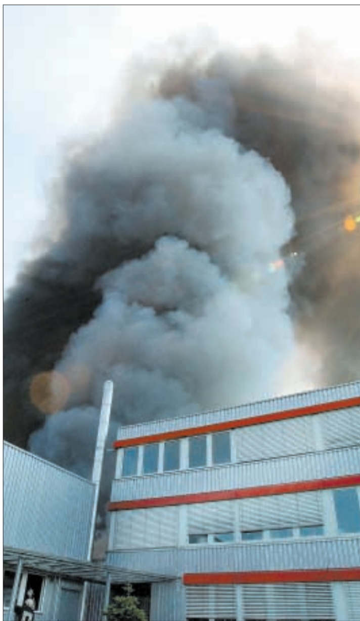
Brennender Kunststoff war für den schwarzen Rauch über der Schaerer AG verantwortlich.

In der betroffenen Halle seien Klein-Kaffeemaschinen produ-